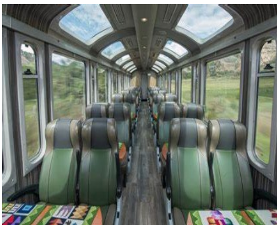
Belmond Hiram Bingham